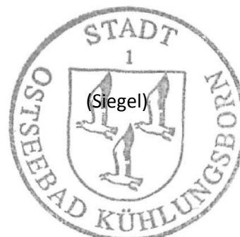
Rüdiger Kozian Bürgermeister

Die Öffentlichkeit kann sich frühzeitig in der Stadtverwaltung von Kühlungsborn, Bauamt, Zimmer 30, Ostseeallee 20, 18225 Kühlungsborn über die allgemeinen Ziele und Zwecke sowie die wesentlichen Auswirkungen der Planung unterrichten und sich bis zum 17. Dez. 2018 zur Planung äußern.