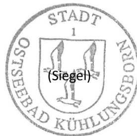
Rüdiger Kozian Bürgermeister

Während der Auslegungszeit können von jedermann Stellungnahmen zum Entwurf schriftlich oder zur Niederschrift abgegeben werden. Nicht fristgerecht abgegebene Stellungnahmen können bei der Beschlussfassung über den Bebauungsplan unberücksichtigt bleiben.